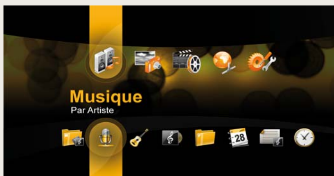
Interface TV du Bewan iMedia HD100

Bewan iMedia HD100 est un lecteur multimédia HD de salon qui supporte les principaux formats de fichiers audio, vidéo et photo, y compris les derniers formats vidéo Full HD, jusqu'en 1080p à des fréquences de 23,976 Hz, 24 Hz et jusqu'à 60 Hz. Il offre également la possibilité de lire les contenus multimédias en basse résolution, tels que le format MPEG-1.