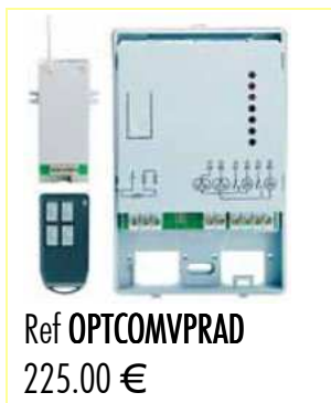
Ref OPTCOMVPRAD 225.00 €